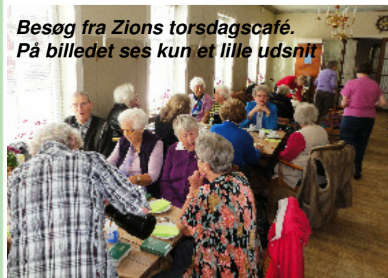
Besøg fra Zions torsdagscafé. På billedet ses kun et lille udsnit

Men det viste sig jo, at nogle af gæsterne kunne huske fra tiden, da Strandbygade 40 var en købmandsgård og nogle havde også handlet i butikken i gamle dage. Det