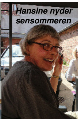
Hansine nyder sensommeren