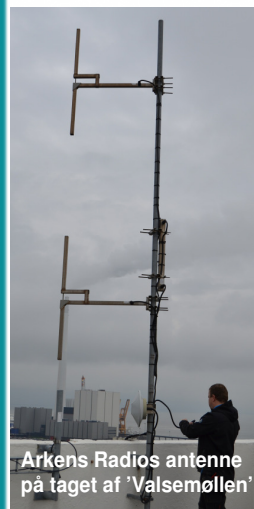
Arkens Radios antenne på taget af 'Valsemøllen'