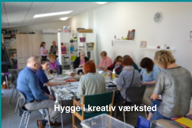
Hygge i kreativ værksted

Onsdag d. 26.: Strikkeklub kl. 14.30 Fredag d. 28.: Fredagstræf kl. 18.00