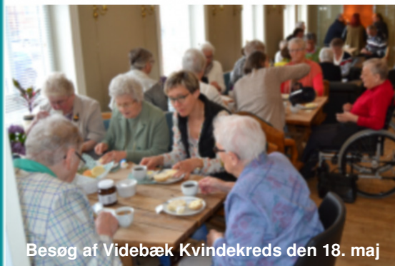
Besøg af Videbæk Kvindekreds den 18. maj

gælder både teen-klubber, menigheder og konfirmander.