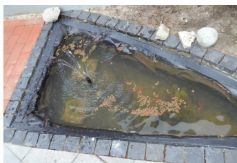
Hvis man ser rigtig godt efter, kan man godt se 6 guldfisk

rigtig meget over at komme ud i gården. Der bliver drukket en masse kaffe og snakket på livet løs, mens der kikkedes på