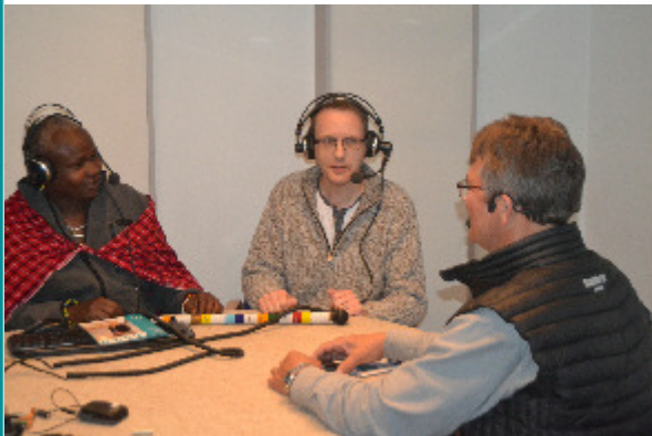
Interview i Arkens Radio

På det seneste har vi bøvlet lidt med Arkens Radio på internettet - webradioen. Vores 10 år gamle computer kunne ikke længere følge med, så vi har måttet investere i en ny, men den har drillet os meget. Når bladet udkommer, regner jeg med, at den skulle være i orden igen.