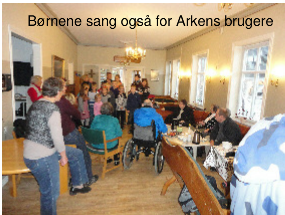
Børnene sang også for Arkens brugere

1. november havde vi besøg af den lokale