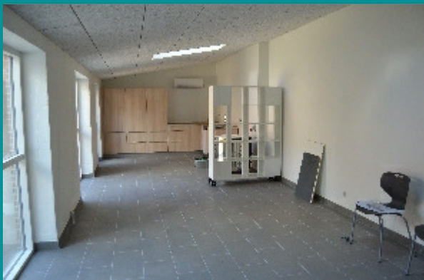
Kahytten set indefra. I baggrunden arbejdsbøkkene