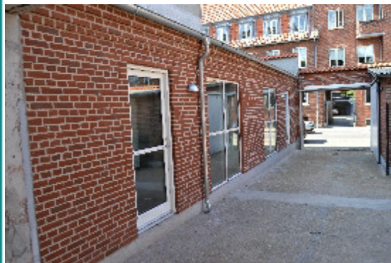
Kahyttens facade set fra gården mod Niels Juelsgade

foregik i Arkens gård med kage og gaver fra brugerne. Tusind tak til jer alle for at I