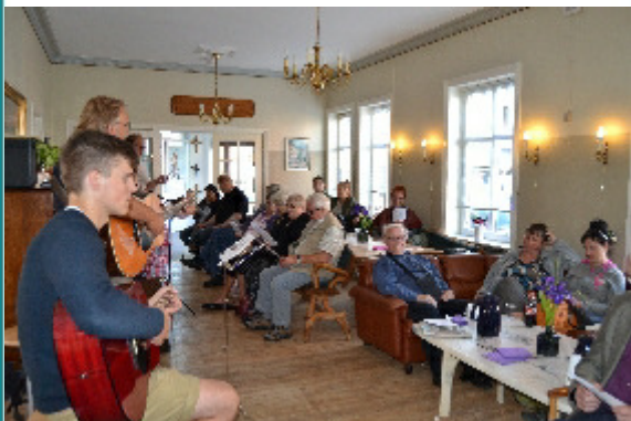
Skt. Hans fest på Arken